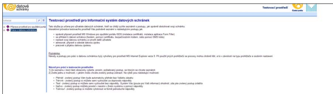
Obrázek č. 3 Testovací prostředí pro Informační systém datových schránek