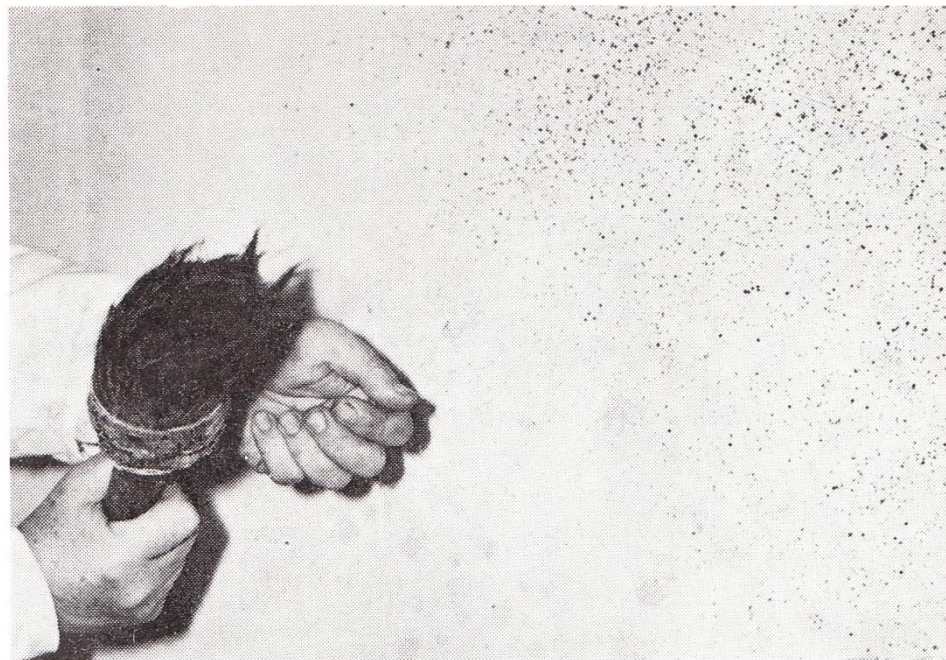
13 Technika stříkací stříkacím štětcem